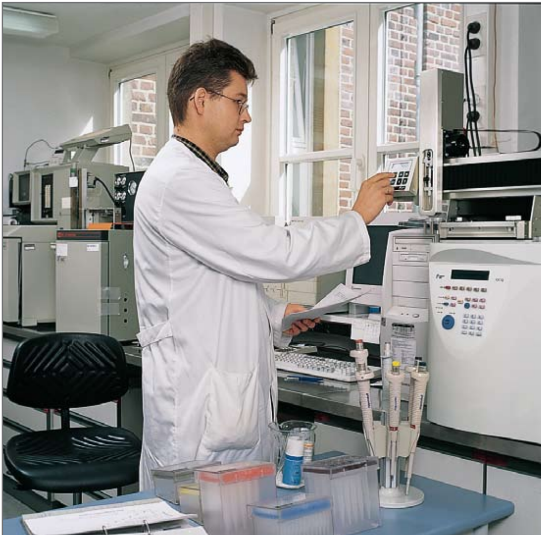
Omgevingsluchtmonsters worden met behulp van testgassen op de gaschromatograaf onderzocht.